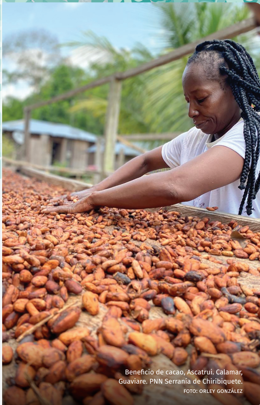
Beneficio de cacao, Ascatrui. Calamar, Guaviare. PNN Serranía de Chiribiquete.

Se estima que un profesional podría analizar una ficha de caracterización en un periodo de 2 días, generando los resultados esperados por la aplicación de la herramienta.